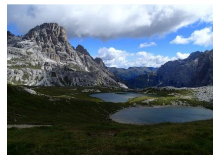
ドライツィンネ小屋付近の池