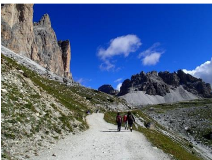
快適なトレチーメのハイキング道