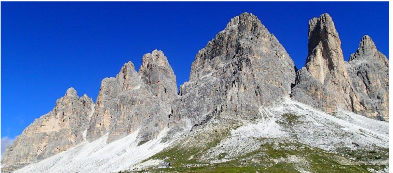
トレチーメ周回ハイキング（オーロンゾ小屋～ラヴァレード峠～ドライツィンネ小屋～フォルチェリーナ峠～メッツ峠～オーロンゾ小屋）