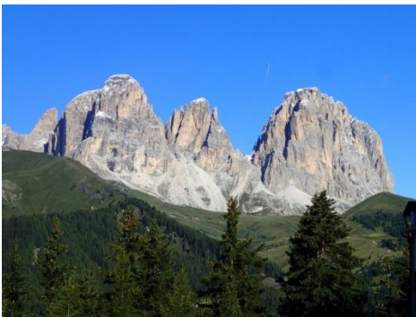
サッソルンゴとセツラ峠（3日目）