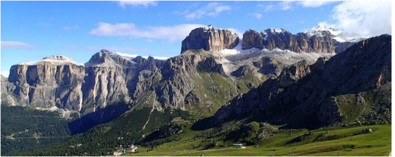
コル・デ・ロッシ展望台からセツラ山群の展望（4日目）