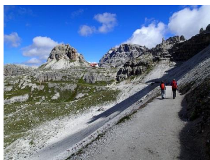
ドライツィンネ小屋へ歩く